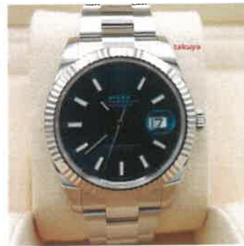
Rolex 126334 DATEJUST 41 FLUTED BEZEL BLUE STICK DIAL OYSTER 2020 FULL SET