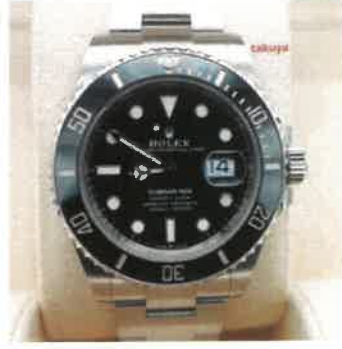
Rolex 126610LN SUBMARINER DATE 41MM NEW MODEL 2021 COMPLETE SET