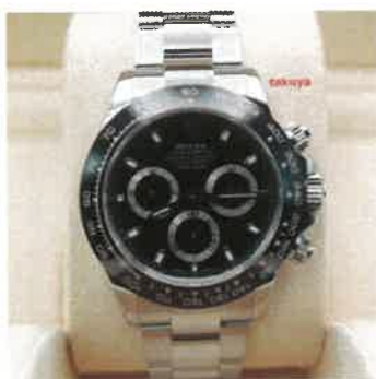
Rolex 116500LN COSMOGRAPH DAYTONA CERAMIC BEZEL BLACK DIAL 2021 FULL SET