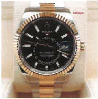
Rolex 326933 SKY-DWELLER 18K YG STEEL BLACK DIAL OYSTER BAND 2022 FULL SET