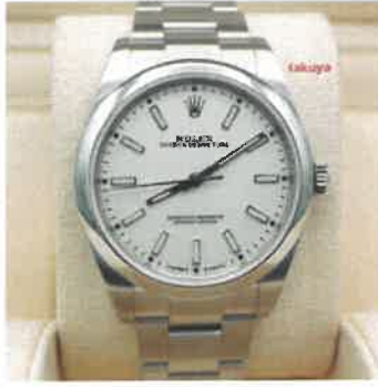
Rolex 114300 OYSTER PERPETUAL NO DATE WHITE DIAL 39MM 2019 BOXES PAPERS