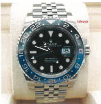
Rolex 126710BLNR GMT MASTER II BLACK BLUE BEZEL JUBILEE BAND 2023 FULL SET